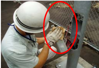
安定器交換状況（漏電回避）