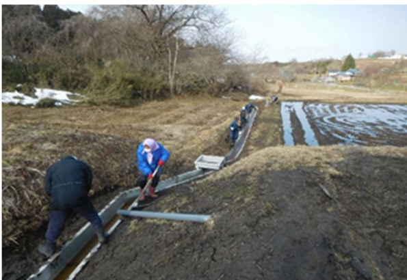
【老朽化した水路の更新】