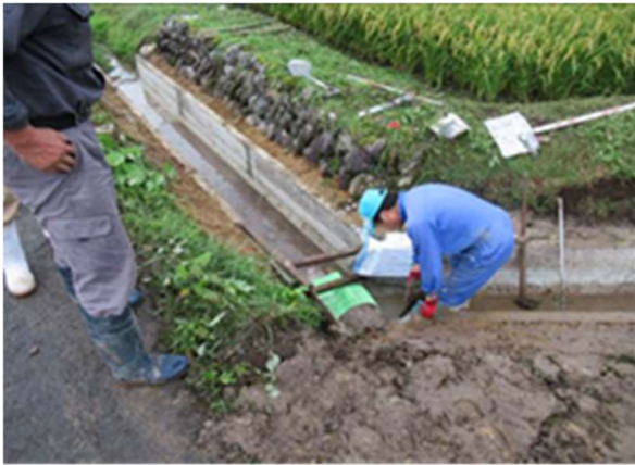
【老朽化した水路の補修】