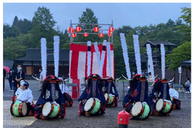
【イベントでの獅子踊の披露】