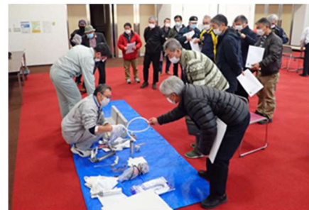
【他地区での実演の様子】