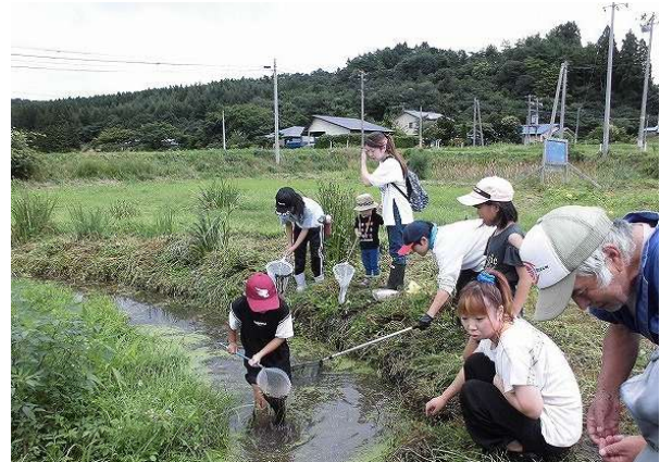
【ビオトープでの生物調査】