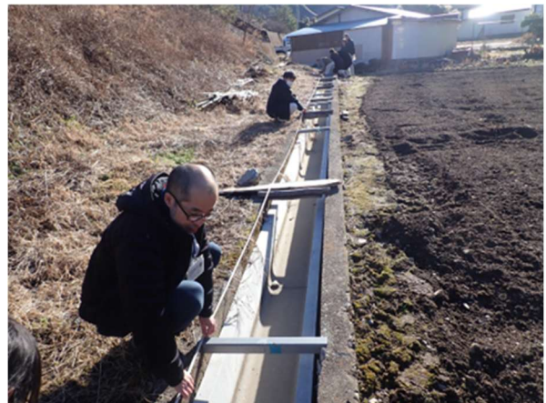
【現地実測確認の様子】